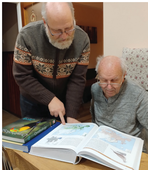
Obr. 3. Aj ako 90-ročný sa stále živo zaujímal o ornitológiu.